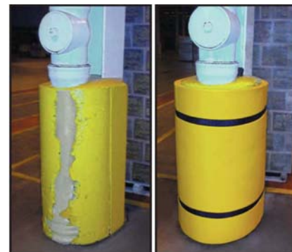
Beton bez ochrany Chráněný Concrete wrap