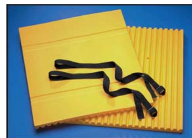
Každá sada Concrete Wrap obsahuje: dva kusy 110 cm široké dva fixační pásy, schopné pokrýt sloup o průměru 60 cm