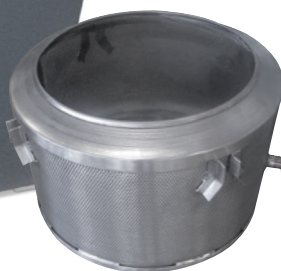
Nerezový koš AISI 304. AISI 304 stainless steel basket. Trommel aus Edelstahl AISI 304. Panier en acier inox AISI 304.