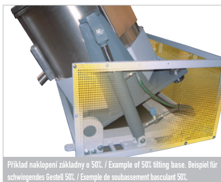
Příklad naklopení základny o 50%. / Example of 50% tilting base. Beispiel für schwingendes Gestell 50%. / Exemple de soubasement basculant 50%.