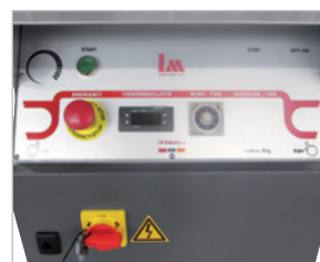
Elektrický rozvaděč / Electric cabinet. Schaltschrank / Armoire électrique.