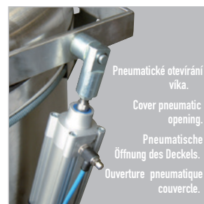
Pneumatické otevírání víka. Cover pneumatic opening. Pneumatische Öffnung des Deckels. Ouverture pneumatique couvercle.